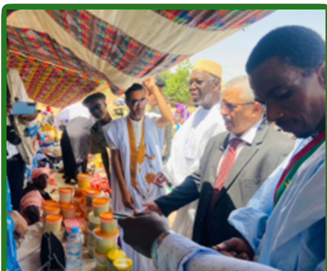
Le Wali de Guidimaga et le président du conseil régional avec le maire à l'ouverture du festival de Sélibabi