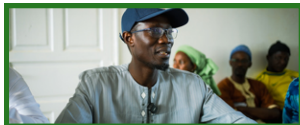
Coordonnateur du PRDC-VFS Sénégal

Face aux défis communs — crues, sécheresse, insécurité alimentaire, maladies transfrontalières comme la fièvre de la vallée du Rift — la coopération n'est plus une option, mais une nécessité vitale. C'est dans cet esprit que le PRDC-VFS, cofinancé par la Banque mondiale et mis en œuvre au Sénégal par le PUMA sous la tutelle du Ministère des Infrastructures, déploie une approche résolument transfrontalière