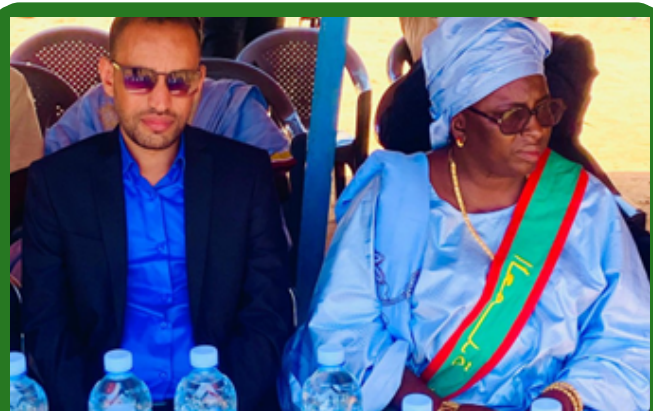
Hakem et la député de Guouray lors du lancement de l'ouverture des activités culturelles

Dans ce cadre vingt sept (27) activités de cohésion sociales notamment des festivals, des soirées artistiques et culturelles et des compétitions sportives ont été organisées dans les communes frontalières et ont permis, entre autres effets, à resserrer les liens de solidarités entre les populations locales aussi bien au niveau interne qu'à l'échelle transfrontalière.