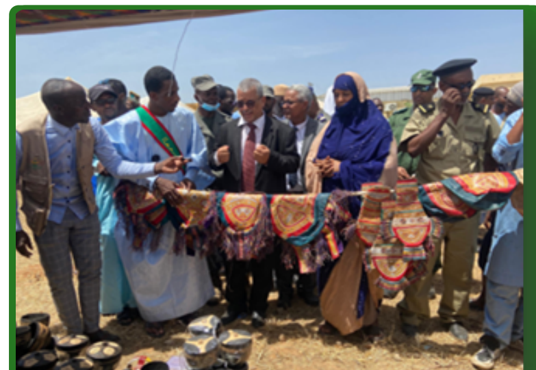
Exposition des produits artisanal à Sélibabi