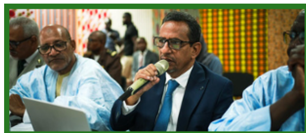
Coordonnateur du PRDC-VFS Mauritanie