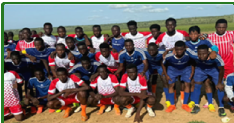
Equipe de sportive de Gouray